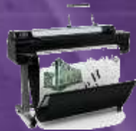
Designjet T1500 Drucker