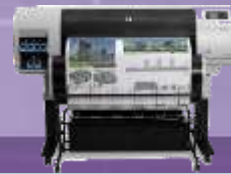
Designjet T7200 Drucker

CAD + GRAFIK Technik - Zubehör - Service