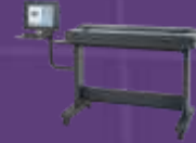
Designjet HD Scanner