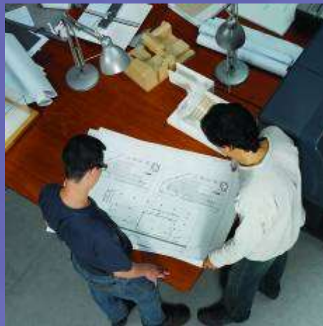
CAD / MCAD / GIS