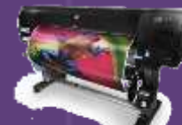
Designjet Z6200 Photo Drucker