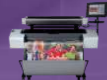
Designjet T1200 HD-MFP