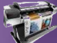
Designjet T2500 eMFP