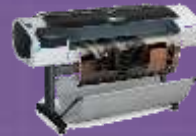
Designjet T1300 Drucker