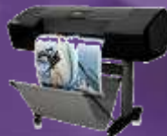
Designjet Z2100 Photo Drucker