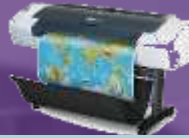
Designjet T920 Drucker